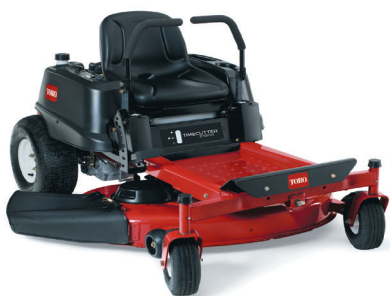
Z 4200 Single