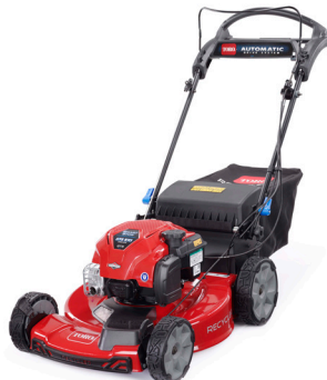
550C REC Full Equip