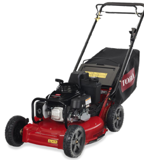
Pro 53 II