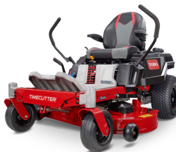
Z 4200 Twin